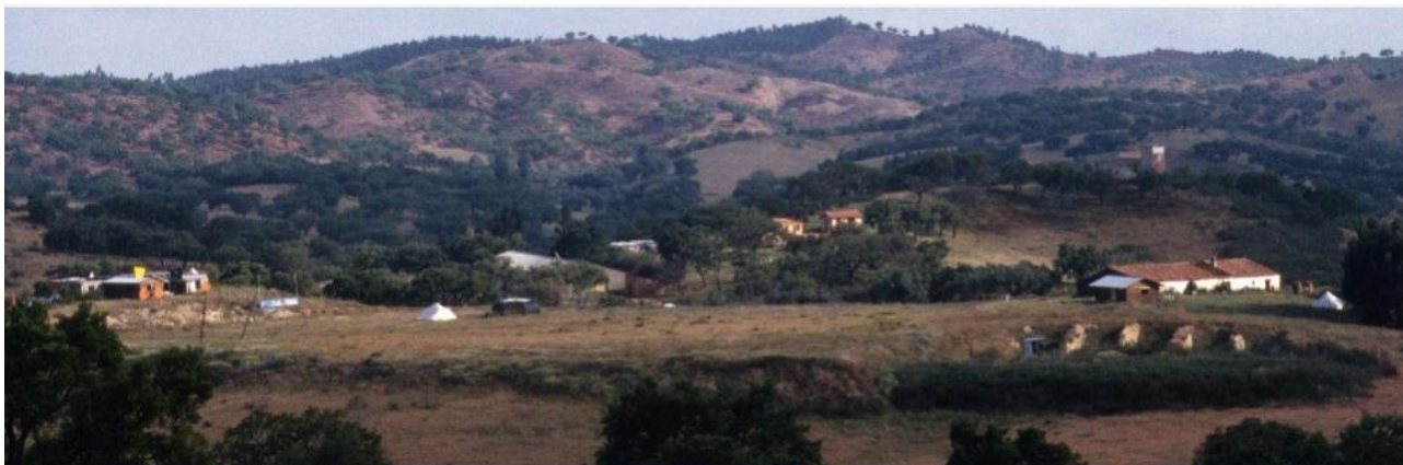
Тамера в первые годы своего существования

что происходит катастрофа - мы ощущали, что проходим через важное испытание, которое делает нас сильнее и гибче. Что-то в нас стало теперь ещё серьёзнее и ещё крепче.