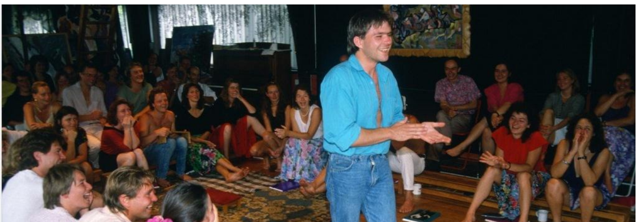
SD Forum (Форум самовыражения) в коммуне, 1983 г.

Для того чтобы осуществить подобный проект, необходимо было прибегнуть к необычным методам. Мы не были трусами и были готовы делать почти всё, что угодно. И в ходе этого удивительного и полного приключений общинного опыта мы пробовали разные средства, и наши концепции касательно того, что эффективно для человеческого исцеления, изменились и продолжали меняться. Вначале мы сфокусировались на использовании музыки, театра и самовыражения перед лицом группы как на основных средствах для прорыва сквозь нашу телесную [и эмоциональную] закомплексованность, чтобы высвободить и выразить те эмоции, которые были похоронены в бессознательной части нашей психики [вследствие подавления и травм прошлого]. Формирование нашей команды началось именно с метода "самовыражения", или сокращённо - SD (нем. Selbstdarstellung). Группа собиралась вместе каждый вечер на Форум Самовыражения (SD Forum) в переоборудованной мансарде нашего большого дома. Именно эти вечера стали той самой "общинной связкой", которые удерживали нас вместе.