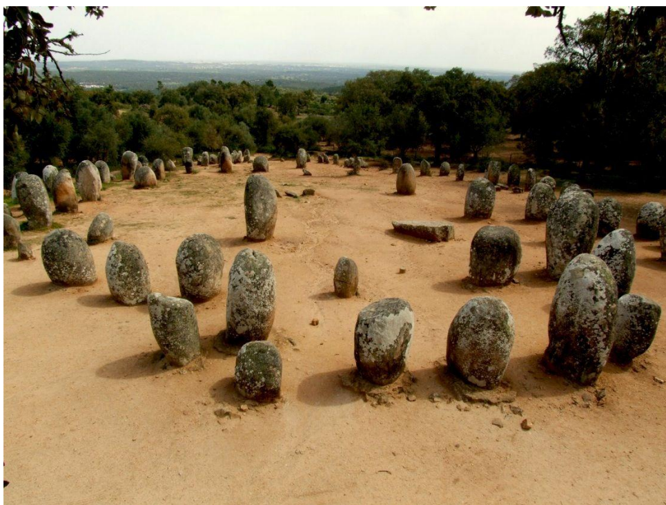
Круг камней (Cromleque dos Almendres) близ г. Эвора, в Португалии.

"центров силы". Таким образом, эти особенности места предопределили приоритетное направление нашей работы - погружения в прошлое посредством регрессивного гипноза для сбора археологических данных и изучение древних источников для доступа к образам Сакральной Матрицы, которые в скрытой форме существовали здесь. Другим очевидным направлением работы стало создание международной миротворческой сети, которая функционировала бы на тех же принципах, которые мы обнаружили в организации доисторической сети мест силы. Созидание глобальной сети [и постоянное ощущение себя в связи с ней] стало важной частью миротворческого мышления, даже если основная деятельность человека или общины сосредоточена на отдельном конкретном участке земли. Идея исцеляющих живых пространств становилась всё более ясной. Так мы снова оказались вовлечены в исследовательскую работу, которая заняла нас на протяжении многих лет и снова ввела нас в соприкосновение с основополагающими силами жизни и человеческой истории. В ходе неё мы обнаружили базовый "божественный" паттерн человеческого сообщества, "элементарную историческую утопию" 17 , существующую как скрытый образ в подсознании сегодняшнего человека практически в том же виде, как и 10 тысяч лет назад. Этот паттерн символически изображён в виде круга камней (Кромлех дос Альмендес) недалеко от г. Эвора в Потругалии.